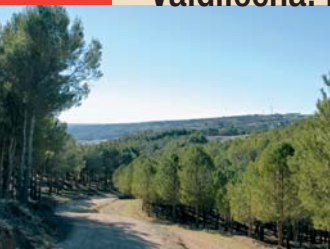
▲ Ruta del Pinar.

Valdilecha ofrece dos paisajes bien distintos. El llano que corona el pueblo donde se cultiva el cereal y el valle, que con un relieve desigual, se abre paso entre cerros y barrancos, útil para el cultivo de viñas y olivares. El entramado de caminos, abiertos para el tránsito de vehículos agrícolas hace posible realizar tranquilos paseos por el municipio.