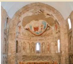
▲ Pinturas Románicas.

Su existencia como núcleo urbano consta a partir del S.XII. En el S.XVI, Felipe II la nombra villa y hasta el S.XIX estuvo sometido al señorío y mayorazgo de familias de la nobleza.